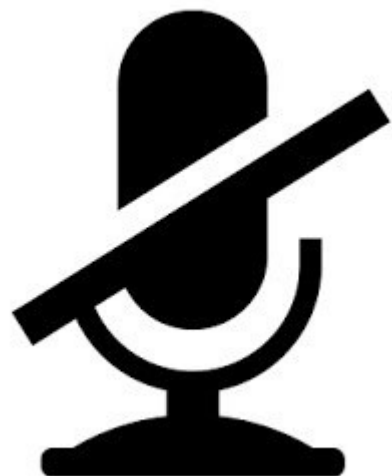
Spegnere il microfono