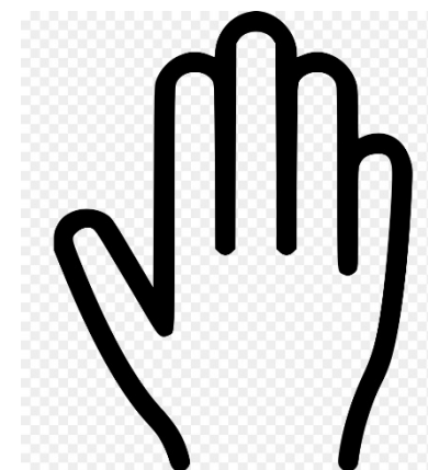
Alzare la mano per parlare