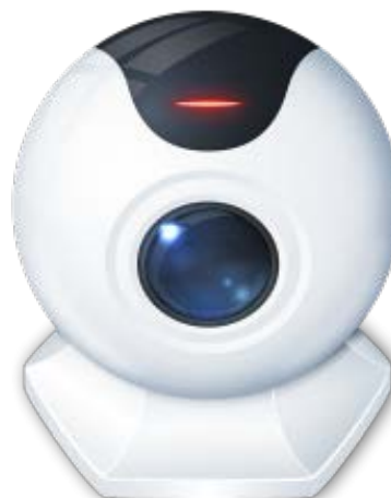
Se problemi di connessione spegnere la webcam